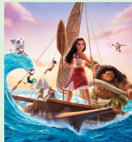
VAIANA 100 min. Lørdag 31. januar 2026 kl. 10.00 Søndag 1. februar 2026 kl. 10.00 Søndag 1. februar 2026 kl. 12.15