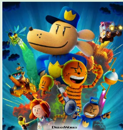
HUNDEMAND 87 min. Lørdag 7. marts 2026 kl. 10.00 Søndag 8. marts 2026 kl. 10.00 Søndag 8. marts 2026 kl. 12.15