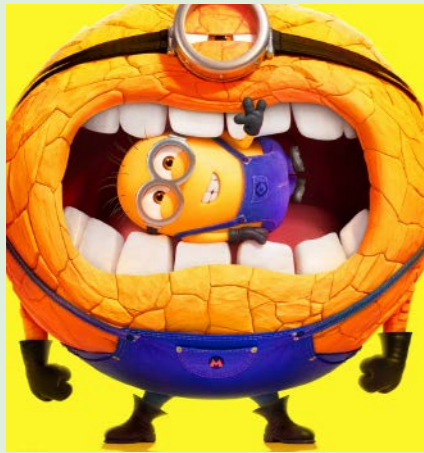
GRUSOMME MIG 95 min. Lørdag 3. januar 2026 kl. 10.00 Søndag 4. januar 2026 kl. 10.00 Søndag 4. januar 2026 kl. 12.15