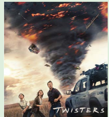
TWISTERS 122 min. Søndag 1. februar 2026 kl. 12.15