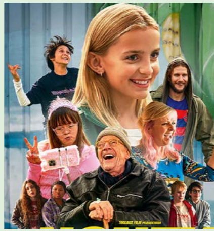
HONEY 94 min. Lørdag 27. sept. 2025 kl. 10.00 Søndag 28. sept. 2025 kl. 10.00 Søndag 28. sept. 2025 kl. 12.15