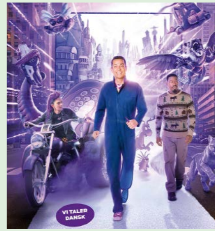
HARALD OG DEN MAGISKE BLYANT 91 min. Lørdag 8. november 2025 kl. 10.00 Søndag 9. november 2025 kl. 10.00 Søndag 9. november 2025 kl. 12.15