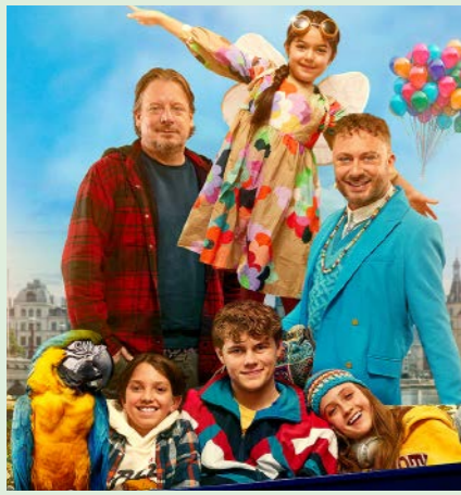
BØRNE FRA SØLVGADE 102 min. Lørdag 27. sept. 2025 kl. 10.00 Søndag 28. sept. 2025 kl. 10.00 Søndag 28. sept. 2025 kl. 12.15