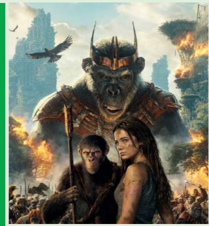
KINGDOM OF THE PLANET OF APES 145 min. Søndag 28. sept. 2025 kl. 12.15