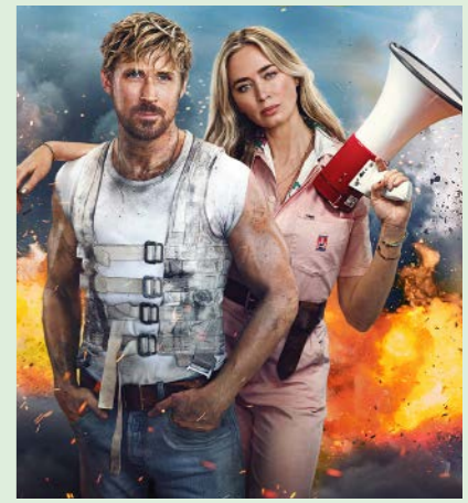
THE FALL GUY 126 min. Søndag 9. nov. 2025 kl. 12.15