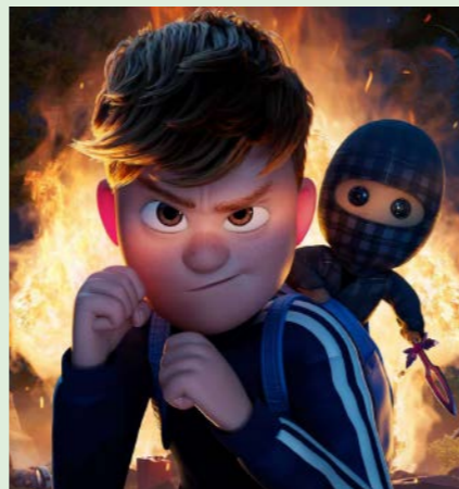
TERNET NINJA 3 85 min. Lørdag 7. marts 2026 kl. 10.00 Søndag 8. marts 2026 kl. 10.00 Søndag 8. marts 2026 kl. 12.15