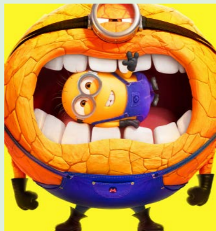
GRUSOMME MIG 95 min. Lørdag 3. januar 2026 kl. 10.00 Søndag 4. januar 2026 kl. 10.00 Søndag 4. januar 2026 kl. 12.15