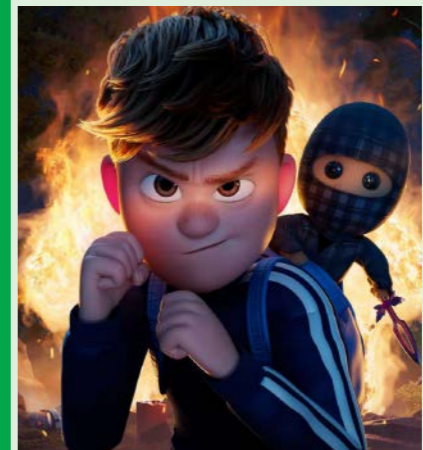
TERNET NINJA 3 85 min. Søndag 8. marts 2026 kl. 12.15