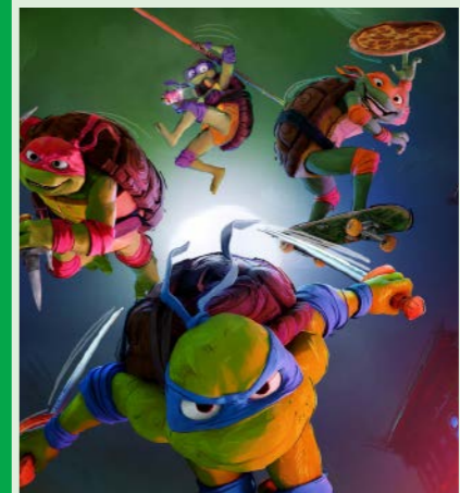
TEENAGE MUTANT NINJA TURTLES 99 min. Søndag 4. januar 2026 kl. 12.15