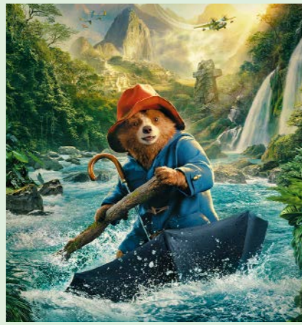
PADDINGTON I PERU 106 min. Lørdag 8. november 2025 kl. 10.00 Søndag 9. november 2025 kl. 10.00 Søndag 9. november 2025 kl. 12.15